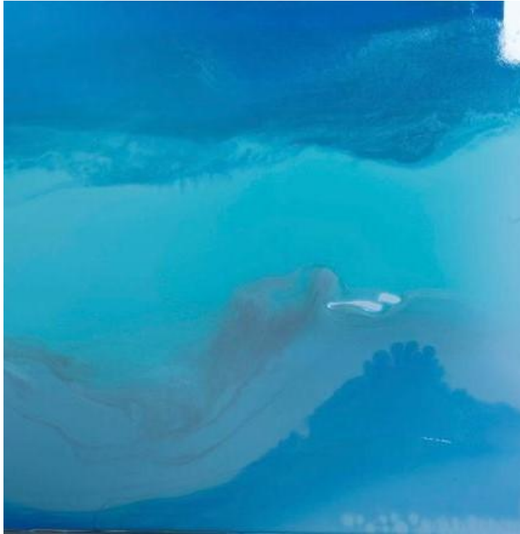
BLUE ELEMENT 7